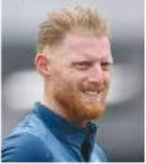
स्टोक्स की फिटनेस के बारे में कहा कि उन्हें नेट्स में वापस आते और पूर्ण फिटनेस की ओर बढ़ते

धर्मशाला। आईसीसी क्रिकेट विश्व कप 2023 में इंग्लैंड का दूसरा मैच धर्मशाला में बांग्लादेश के खिलाफ है। मैच से पहले इंग्लैंड के कप्तान जोस बटलर ने टीम के स्टार ऑलराउंडर बेन स्टोक्स की उपलब्धता को लेकर बयान दिया। उन्होंने कहा कि स्टोक्स पूर्ण फिटनेस की ओर बढ़ रहे हैं लेकिन उनके कल के मैच में खेलने की संभावना नहीं है। इंग्लैंड के स्टार ऑलराउंडर बेन स्टोक्स को कुल्हे में चोट है, जिस कारण वह न्यूजीलैंड के खिलाफ विश्व कप के शुरुआती मैच में भी नहीं खेल पाए थे। अब कल के मैच में भी उनके खेलने की संभावना नहीं है। जोस बटलर ने मैच से पहले प्रेस कॉन्फ्रेंस में