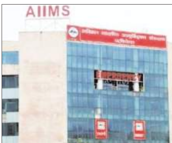
जागरूकता बढ़ाना है। यह दिन मानसिक स्वास्थ्य के मुद्दों पर कार्य करने वाले सभी लोगों को अपने काम के बारे में बात करने

8 विश्व मानसिक स्वास्थ्य दिवस का उद्देश्य मानसिक स्वास्थ्य के मुद्दों के बारे में जागरूकता बढ़ाना है।