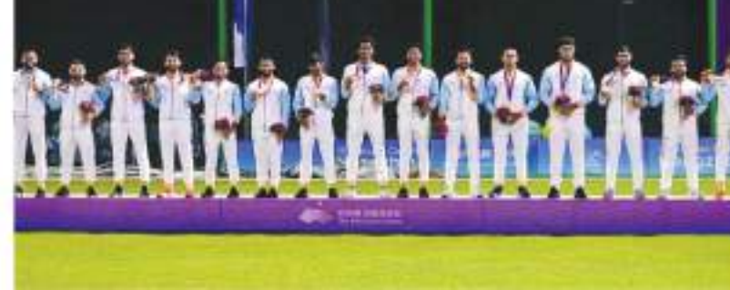
1900 के पेरिस ओलंपिक में खेला गया था, जहाँ इंग्लैंड और फ्रांस स्वर्ण पदक के लिए भिड़े थे। हालांकि, लंबे समय से क्रिकेट को ओलंपिक में शामिल करने की कोशिशें चल रही हैं, लेकिन ऐसा संभव नहीं हो पाया। दरअसल, आईओसी क्रिकेट की लोकप्रियता को ध्यान में रखते हुए भारतीय उपमहाद्वीप के बाजार को धुन्ने की कोशिश करेगा। इसके लिए पुरुष और महिला टी-20 क्रिकेट को ओलंपिक में शामिल किया जाएगा। रिपोर्ट के अनुसार, क्रिकेट के शामिल होने पर 2024

नई दिल्ली। क्रिकेट को 128 साल बाद ओलंपिक में शामिल किए जाने की तैयारी कर ली गई है। 2028 के लॉस एंजेलिस ओलंपिक में क्रिकेट शामिल होगा। द गार्जियन की रिपोर्ट के अनुसार, क्रिकेट के साथ फुटबल, बेसबॉल, सुबॉल्टल को भी शामिल किया जाएगा। मुंबई में 15 अक्टूबर से होने वाले अंतरराष्ट्रीय ओलंपिक समिति (आईओसी) के 141वें सत्र में क्रिकेट का शामिल होना तय है, जबकि लैम्बुज और स्कॉट्स इन खेलों के अतिरिक्त खेल होंगे। क्रिकेट इससे पहले